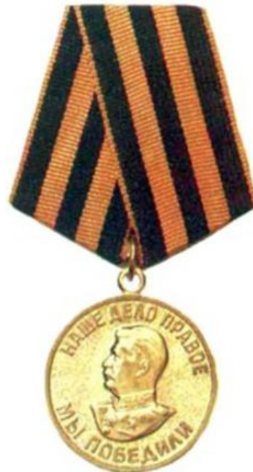
Медаль «За победу над Германией в Великой Отечественной войне 1941-1945