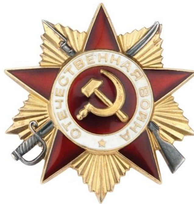
Орден Отечественной войны I степени (06.04.1985)