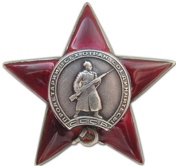
орден Красной Звезды (26.04.1942)