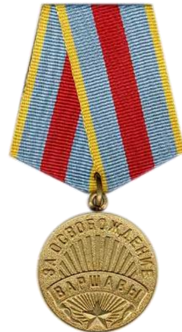
Медаль «За освобождение Варшавы»