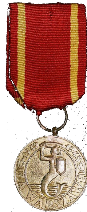
Медаль «За Варшаву 1939- 1945» (ПНР, 1945)