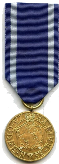
Медаль «За Одру, Нису и Балтику» (ПНР, 1945)