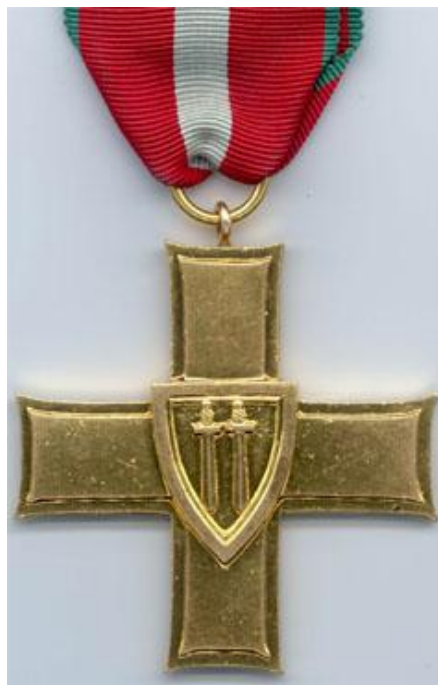
Орден «Крест Грюнвальда» (ПНР, 1945)