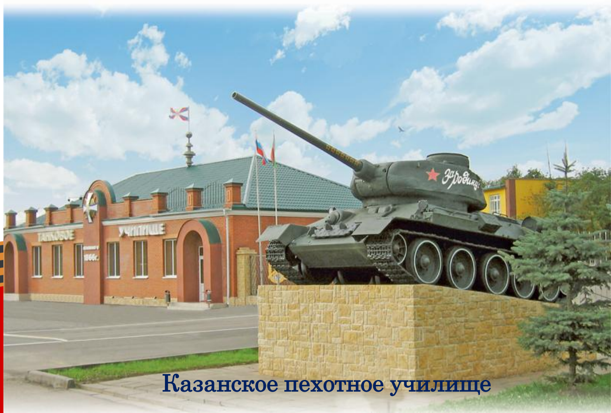
Казанское пехотное училище

В 1921 г. юный Георгий вступил в комсомол. 1 октября 1923 г. с путевкой комсомола направляется в пехотное Казанское училище. Через 3 года уже в Москве оканчивает школу им. ВЦИК.