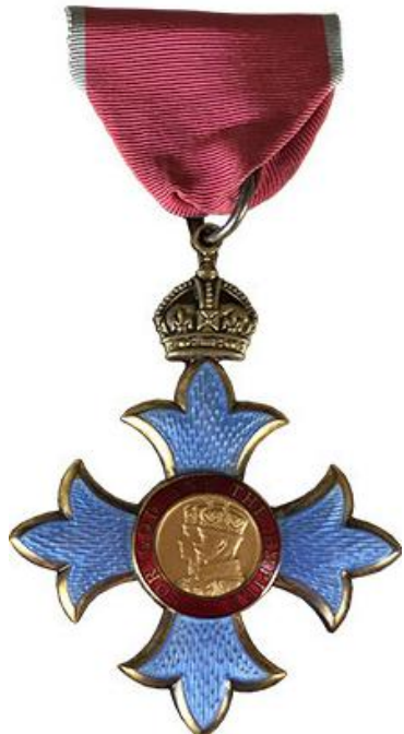
Командор Ордена Британской Империи (Великобритания, 1944)