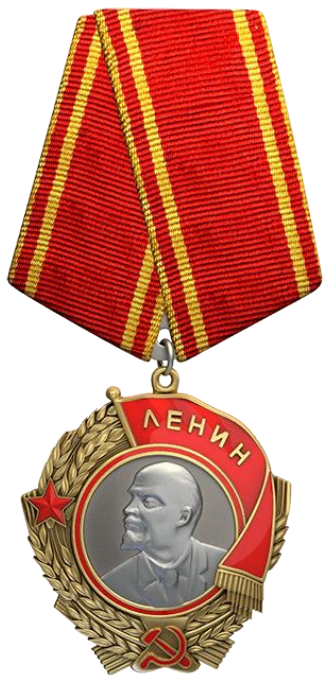
Орден Ленина (17.04.1943)