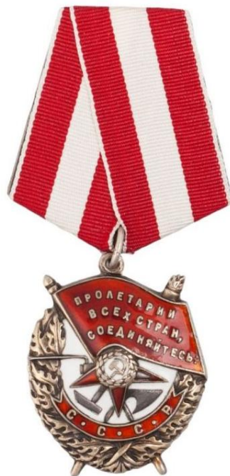
Орден Красного Знамени (30.01.1943, 10.07.1944, 03.11.1944, 17.02.1945)