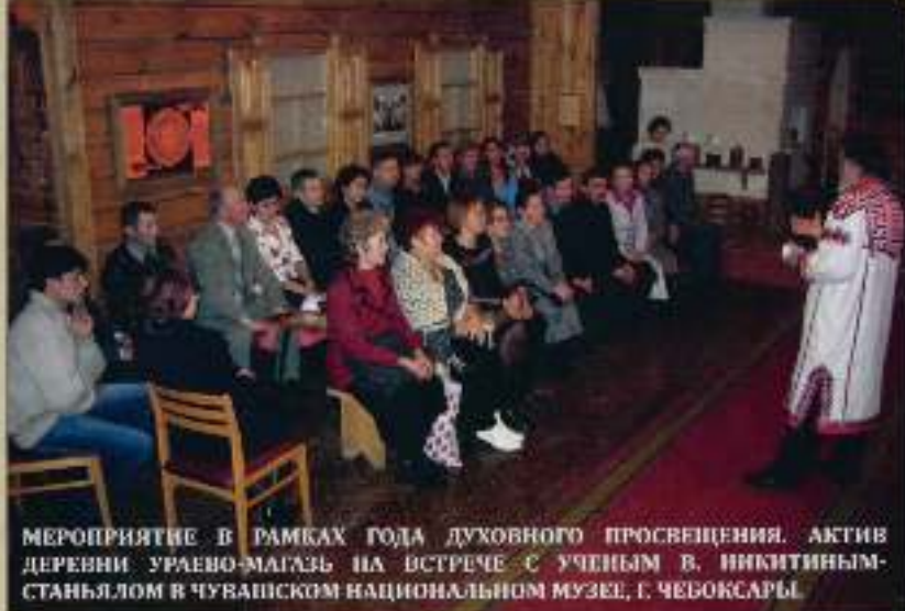
МЕРОПРИЯТИЕ В РАМКАХ ГОДА ДУХОВНОГО ПРОСВЕЩЕНИЯ. АКТИВ ДЕРЕВНИ УРАЕВО-МАГАЗЬ НА ВСТРЕЧЕ С УЧЕНЫМ В. НИКИТИНЫМ-СТАНЬЯЛОМ В ЧУВАШСКОМ НАЦИОНАЛЬНОМ МУЗЕЕ, Г. ЧЕБОКСАРЫ