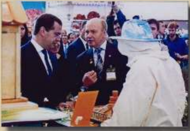
Встреча с Председателем Правительства РФ Д. А. Медведевым

ВСЕРОССИЙСКАЯ АГРОПРОМЫШЛЕННАЯ ВЫСТАВКА "ЗОЛОТАЯ ОСЕНЬ-2013", Г. МОСКВА, ВВЦ