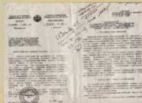
Фото из статьи "Самаха тытмазан", газета "Ленинец" от 19 апреля 1988 г. Фотография и текст Христора Макарова.