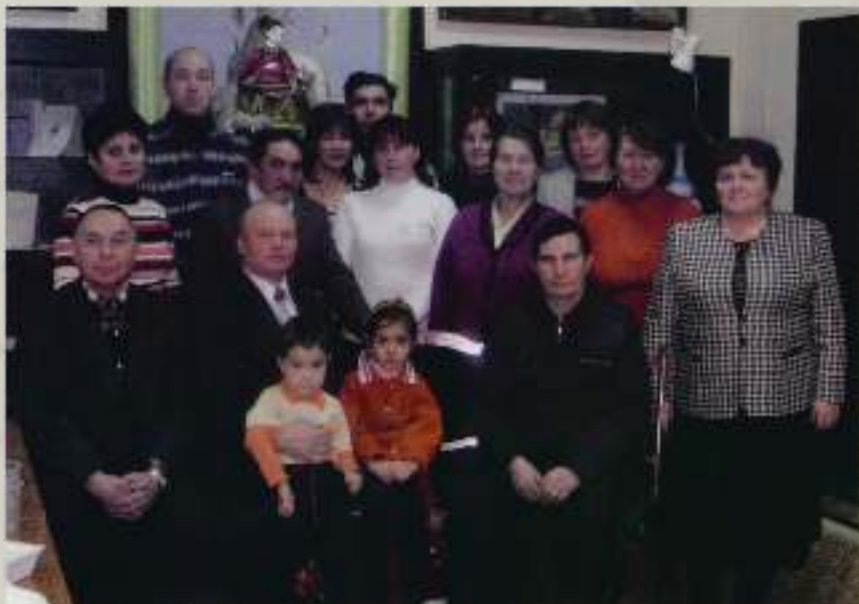
Активисты деревни Ураево-Магазь в музее "Н. Бичурин и современность". Награждение Благодарностями главы Чебоксарского района "За большой вклад в социально-экономическое развитие деревни Ураево-Магазь"

Из статьи в газете "Советская Чувашия" от 2 августа 1996 г.