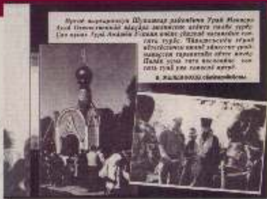
ОСНОВНЫЕ БЛАГОДЕТЕЛИ ПО СТРОИТЕЛЬСТВУ ЧАСОВНИ В ЧЕСТЬ УСПЕНИЯ БОЖЬЕЙ МАТЕРИ ДЕРЕВНИ УРАЕВО-МАГАЗЬ