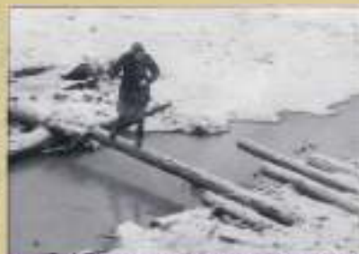
ОТ МОСТОВ И МОСТИКОВ ОСТАЛИСЬ ОДНИ ГНИЛЫЕ СВАИ И ПЕРЕКЛАДНЫЕ