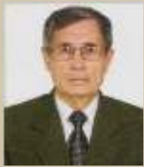
Ф. А. Карягин, министр природных ресурсов и охраны окружающей среды в 1990-е годы, заслуженный эколог Чувашской Республики

В мирное время нелегкое испытание выпало на жителей деревни Ураево-Магазь. Деревня жила целых два десятилетия в условиях неизвестности и даже страха от находящегося рядом химического монстра, производившего страшное химическое оружие.