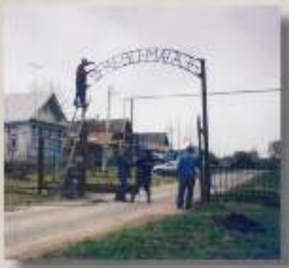
Из статьи в газете "Хресчен Сасси" от 24 мая 1996 г.