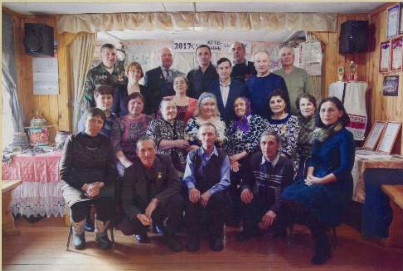
2016 сұлта ытларах тарашакансем