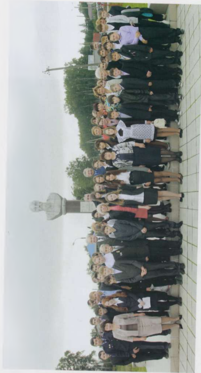
Участники «Бичуринских чтений», 2013 год