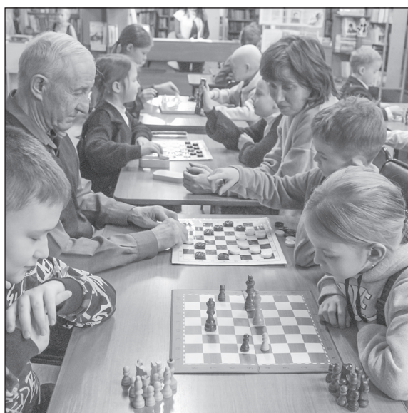
■ Интеллектуальному хобби отдают предпочтение и дети, и родители, и бабушки с дедушками

новную цель состязания — поставить мат королю соперника. Для того чтобы обучение проходило интересно и эффективно, наставники используют самые разные методы. Один из них — это сеанс одновременной игры. Такие сражения надо видеть! В библиотеке разворачиваются отнюдь не детские баталии. Ребята долго обдумывают каждый ход, пытаются предугадать, как им ответит соперник.