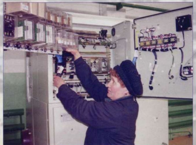
Ишлейские электроаппаратчики за работой