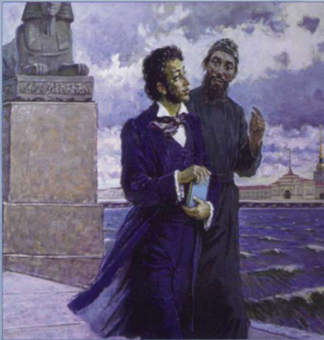
Фрагмент картины народного художника России Н. Овчинникова «Н.Я. Бичурин и А.С. Пушкин»

Р айон образован 1 октября 1927 года по постановлению ВЦИК РСФСР. Но в историко-культурном плане он на протяжении веков привлекал внимание путешественников, краеведов. На слуху каждого образованного человека понятие «абашевская культура».