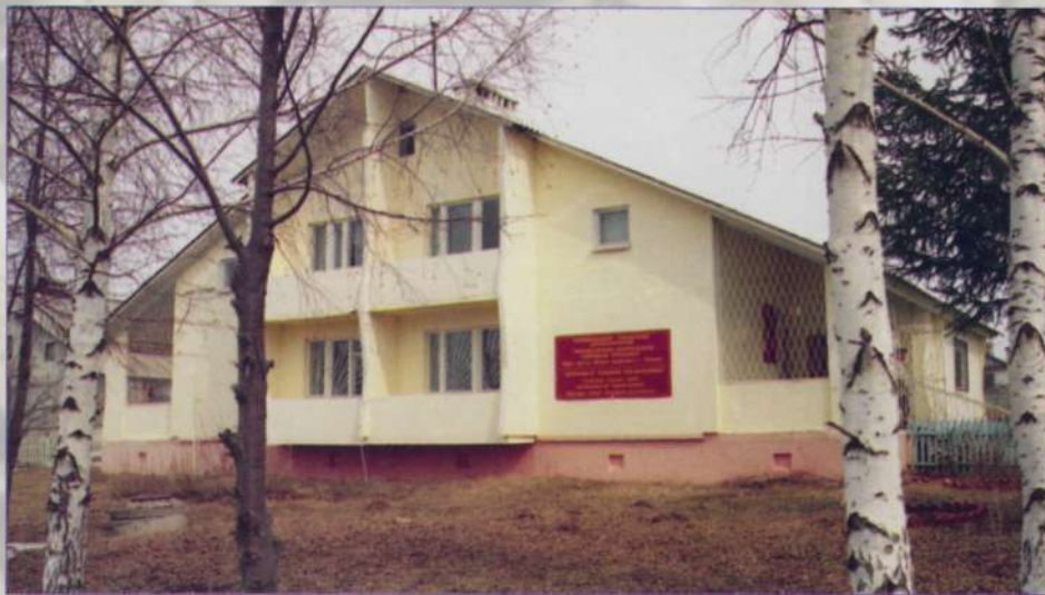
Офис врача общей практики в селе Ишаки

Д ля здешней системы здравоохранения характерна реструктуризация стационарной помощи с одновременным развитием амбулаторно-поликлинического обслуживания. Важным направлением стало внедрение системы общей врачебной практики в рамках соответствующей республиканской программы под личным патронажем Президента Н. Федорова. Открыто четыре офиса врача общей практики – в Атлашеве, Ишаках, Карачурах и Ишляях. Они оснащены самым современным оборудованием.