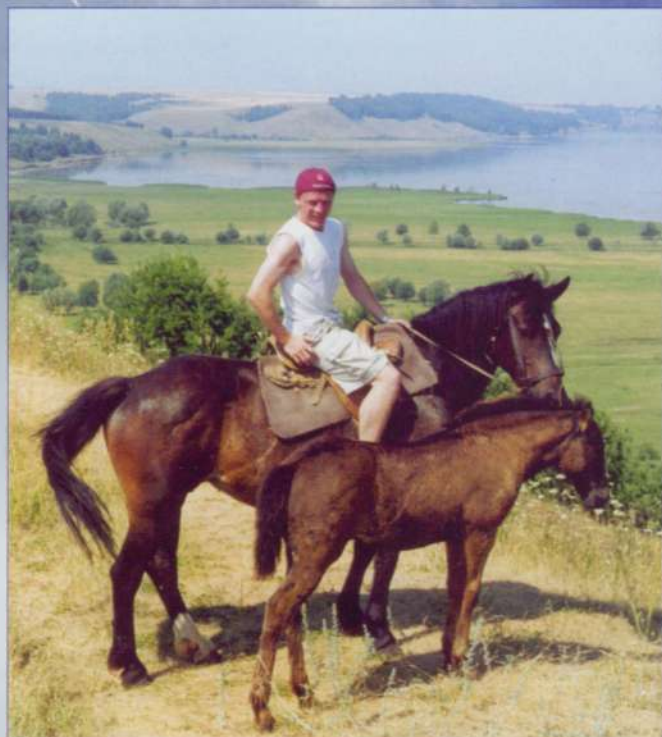
Конный туризм – приволжская экзотика

Летом к вашим услугам прямо у подножия санатория – изумительный пляж.