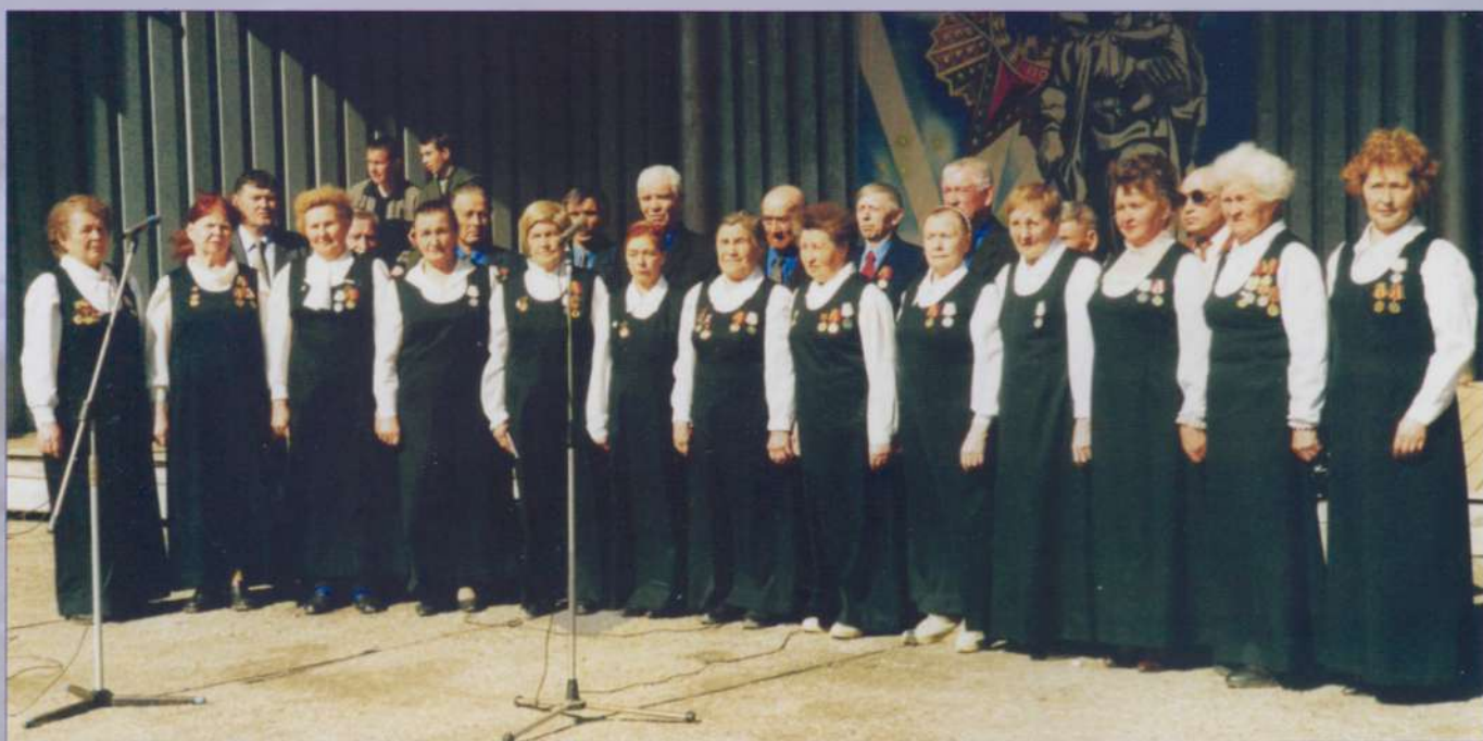
Поет хор ветеранов