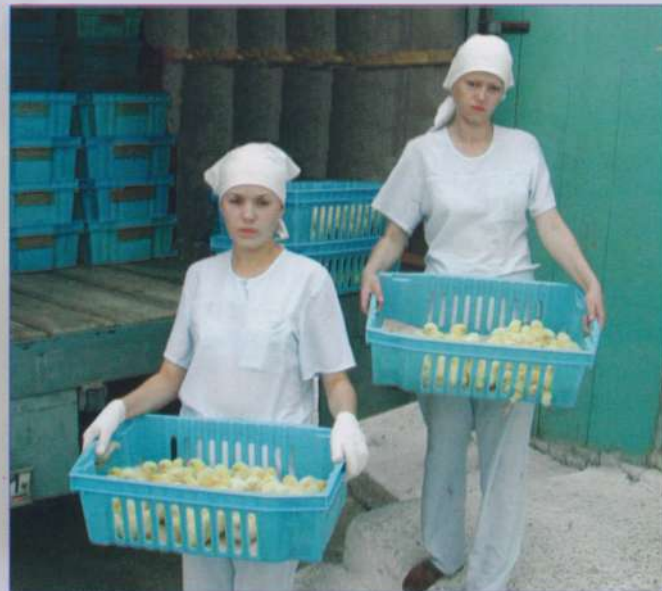
Цыплята вырастут к осени

ОАО «Чувашский бройлер» – одно из ведущих и перспективных предприятий в отрасли мясного птицеводства Чувашской Республики и Волго-Вятского региона, которое специализируется на производстве диетического, экологически чистого мяса цыплят – бройлеров.