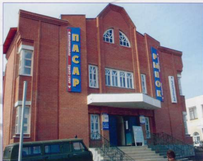
Рынок тоже любит красивое

З а последние десять лет в Чебоксарском районе построено за счет всех источников финансирования 190,1 тыс. кв. м жилья, в том числе 142,6 кв. м – силами индивидуальных застройщиков. Обеспеченность жильем на одного жителя составляет 18,3 кв. м (по республике – 19 кв. м).