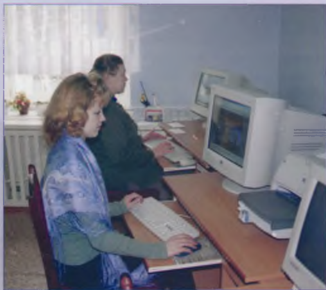
Модельная библиотека в Кугесях

К ультурные традиции района зиждятся на уважении к истории родного края. Поэтому много внимания уделяется музейному делу.