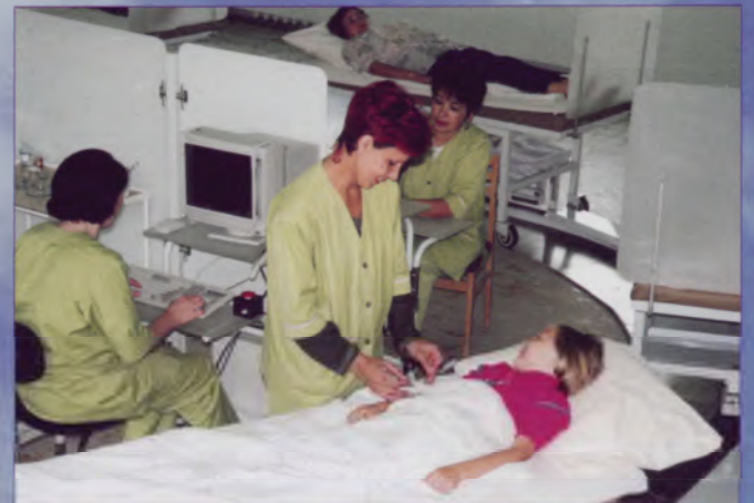
Целебные процедуры в «Волжских зорях»

В сочетании с благоприятными климатическими усло-