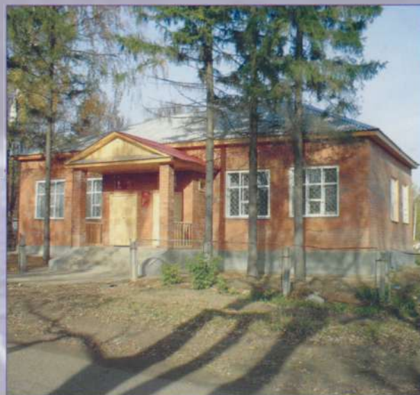
Музей «Н.Я. Бичурин и современность»

В 1983 году был открыт краеведческий музей в селе Ишаки, историческом центре края. Здесь с древних булгарских времен действовало Большое Киреметище с целительным родником и языческим капищем в честь могучего хранителя людского благополучия Микол Торы.