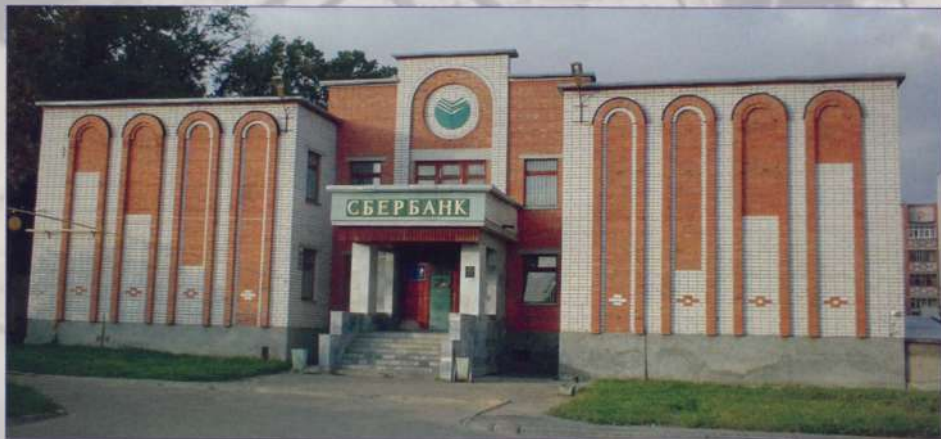
Новое здание филиала Сбербанка

Современный рынок должен быть мощным двигателем НТР, механизмом роста и развития производства. Быстрейшее введение в нашей стране рынка поставит этот механизм на службу человеку.