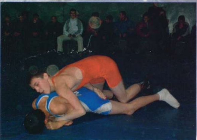
Сила и ловкость