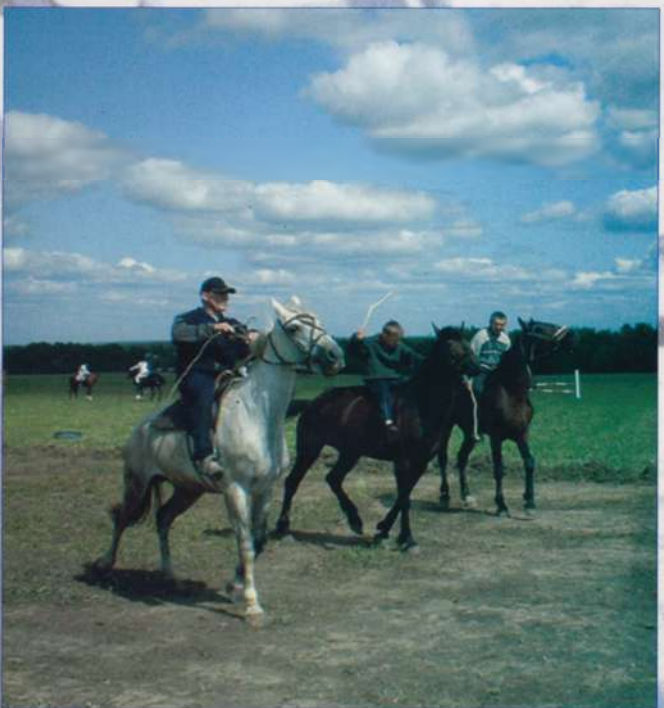
Жокеи на разминке

Здоровье – это бесценный дар, который преподносит человеку природа. Но не будет здоровья, если не станешь заниматься спортом. И к нему надо приучаться с малых лет.