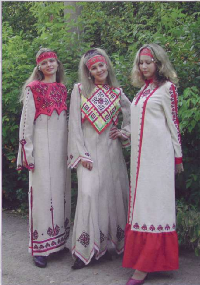
Чудо-платья от «Паха тёрё»