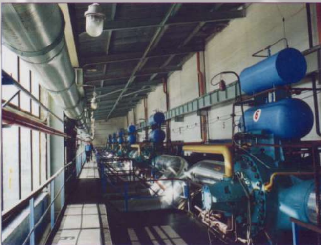
Ишлейская и Абишевская газокompрессорные станции «гонят» голубое топливо Ямала и Уренгоя на запад

В районе действуют более десяти промышленных предприятий различных форм собственности.