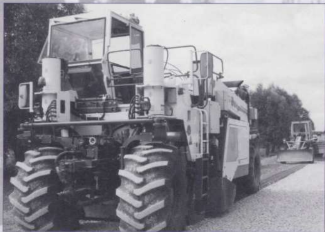
Дороги прокладываются супертехнологией

До 1993 года в районе было газифицировано лишь 33 населенных пункта. За последние десять лет газ пришел в 99 из 171 сел и деревень. В 7445 домах и квартирах пользуются благами «голубого топлива». Введены в эксплуатацию распределительные газовые сети протяженностью 490,7 км. В 2004 году планируется завершить газификацию всех населенных пунктов района.