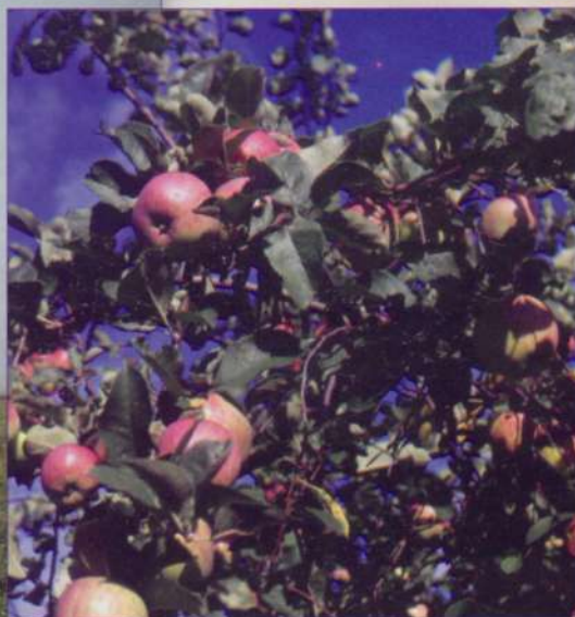
Осенние заботы и дары земледельцев