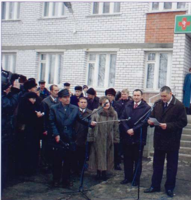
Сдается в эксплуатацию очередная новостройка