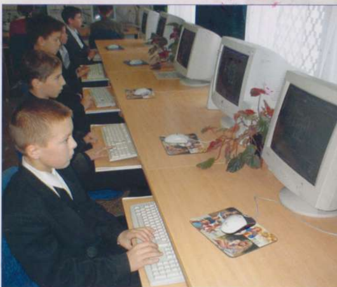
С компьютером – на «ты»