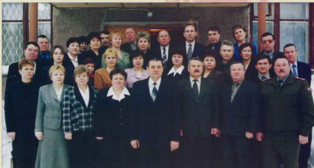
Руководители служб федеральных структур и руководители района