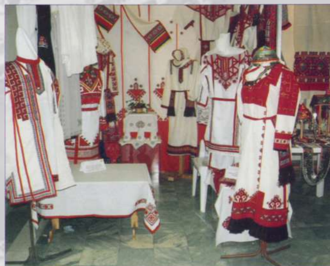
Красота национального костюма

Технологи и дизайнеры фирмы постоянно работают над повышением качества изделий. Предприятие имеет для района непреходящее социальное значение, обеспечивая работой несколько сотен жителей.