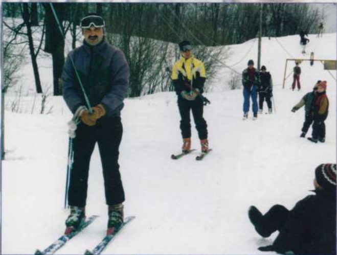
Путь к вершине