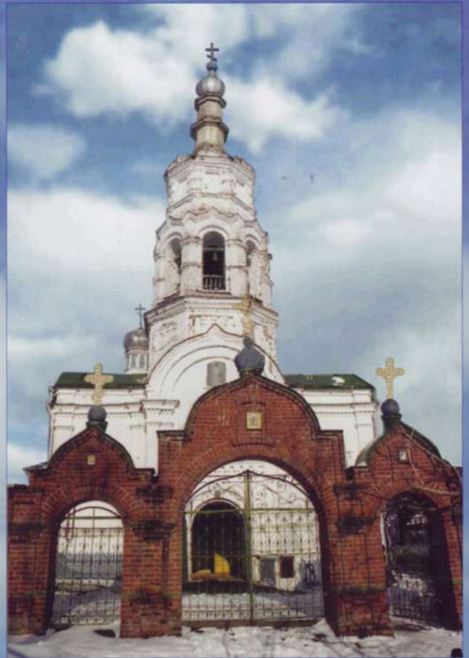
Церковь Рождества Богородицы в селе Янгильдино

По «березовому большаку», проходящему по террито-