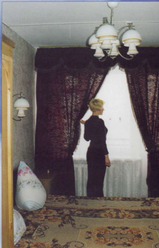
Уютно в номерах «Волжанки»