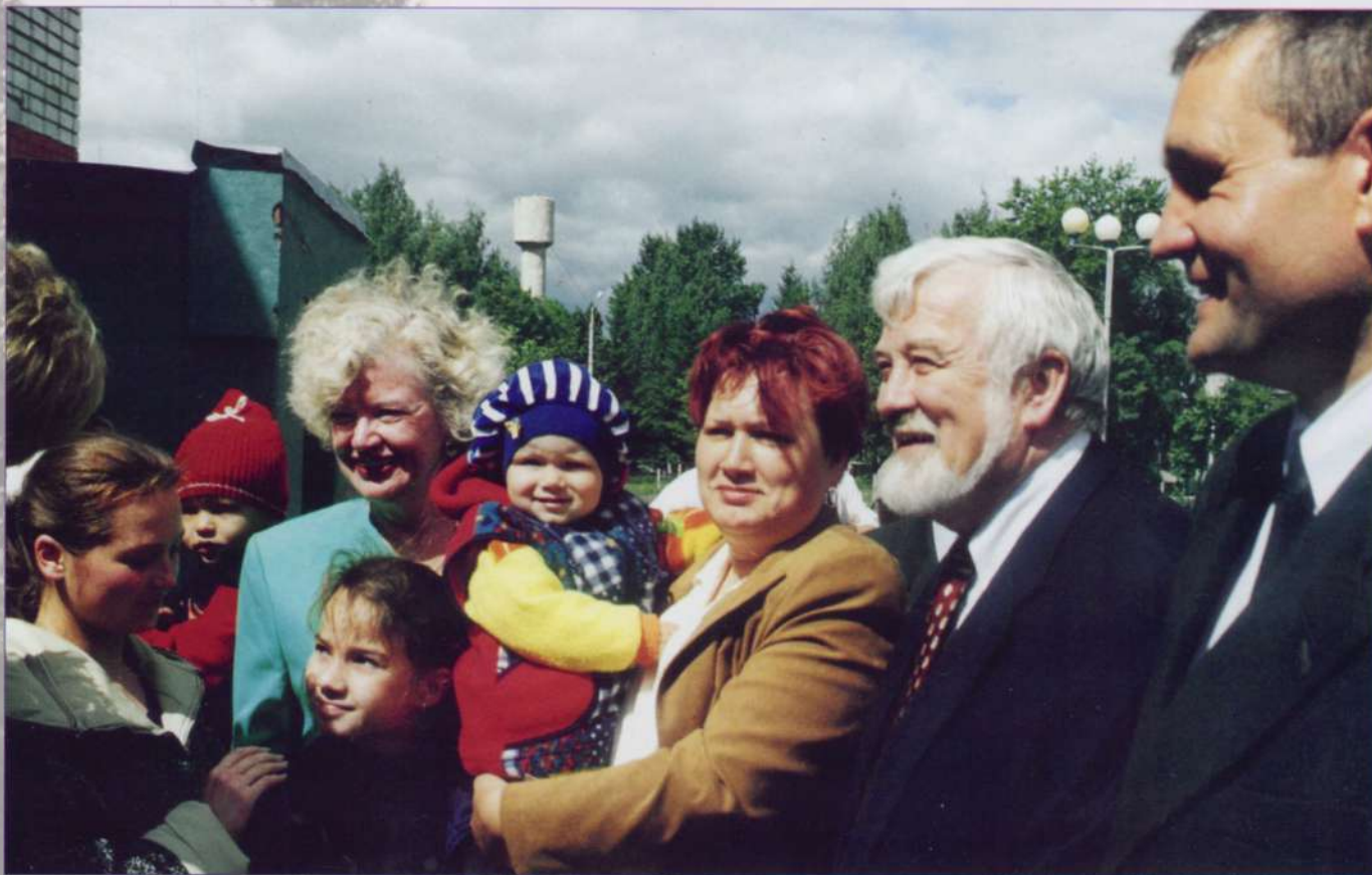
Чрезвычайный и Полномочный Посол Канады в Российской Федерации Рони Ирван на открытии врачебного офиса в Карачурах