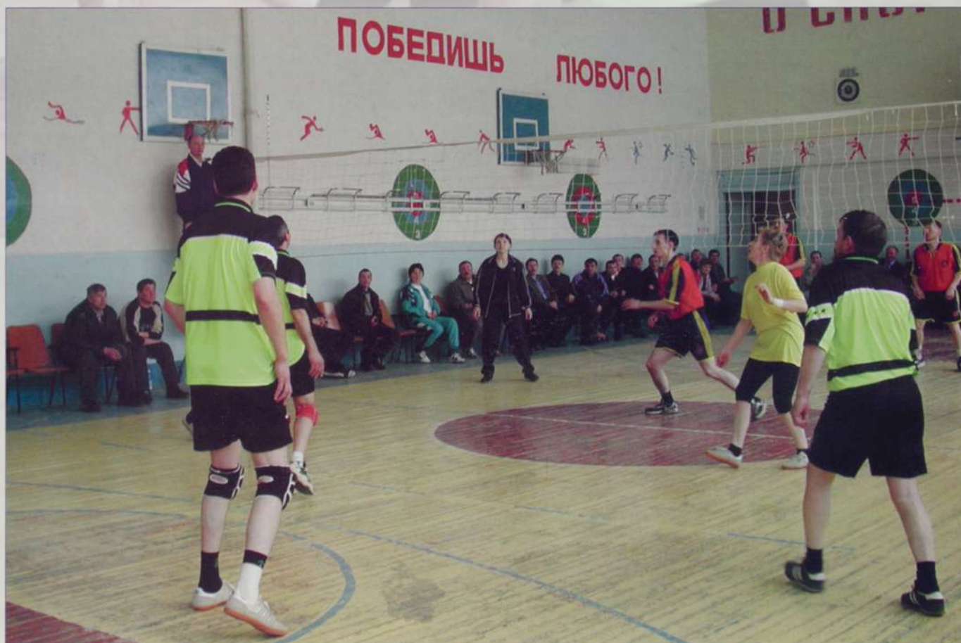
Мяч над сеткой