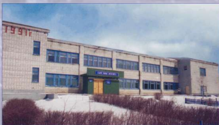
Абашевцам есть где провести досуг (Дом культуры)