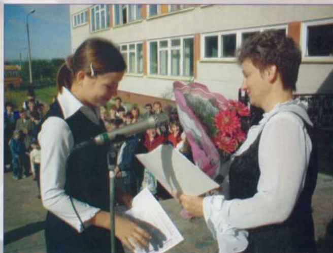
Дорога в балетную жизнь

70 процентов средних школ пользуются Интернетом. Уже четвертый год район участвует в федеральном эксперименте по введению единого госэкзамена.