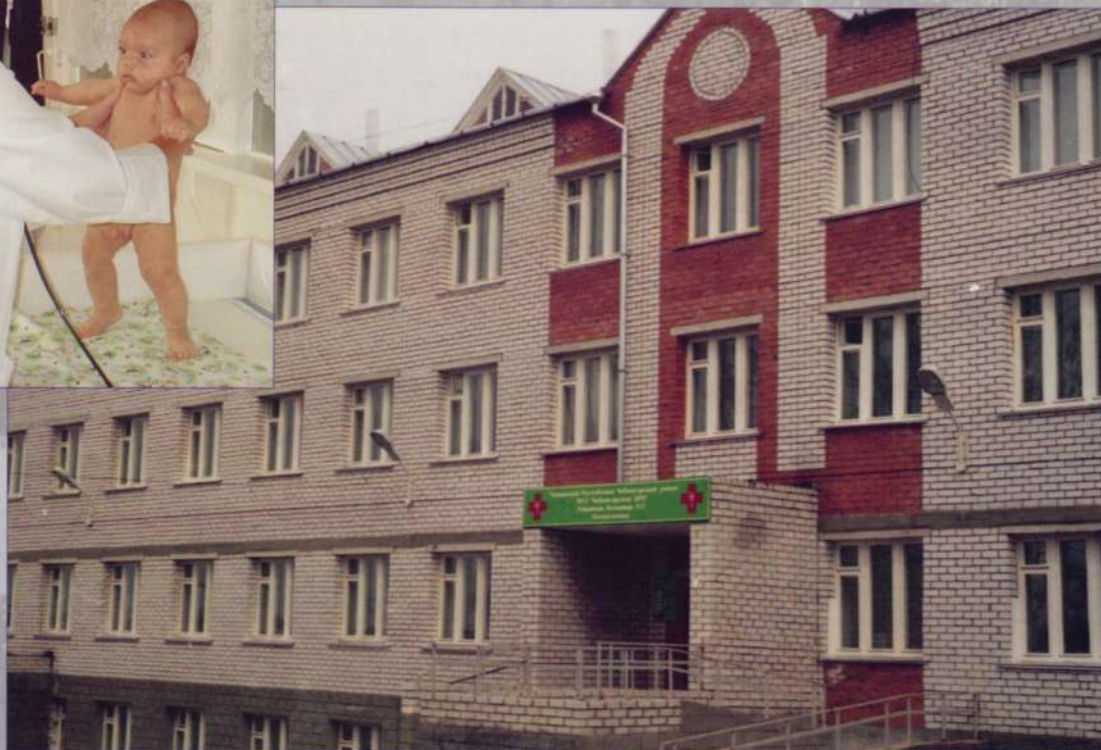
Новая поликлиника в Ишлеях