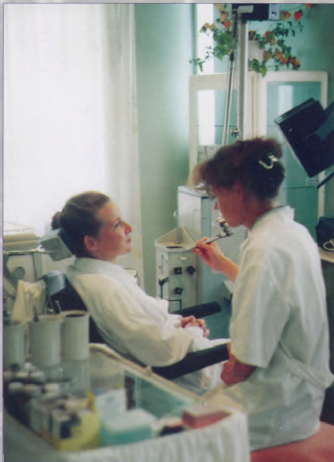
Стоматолог – уважаемая профессия