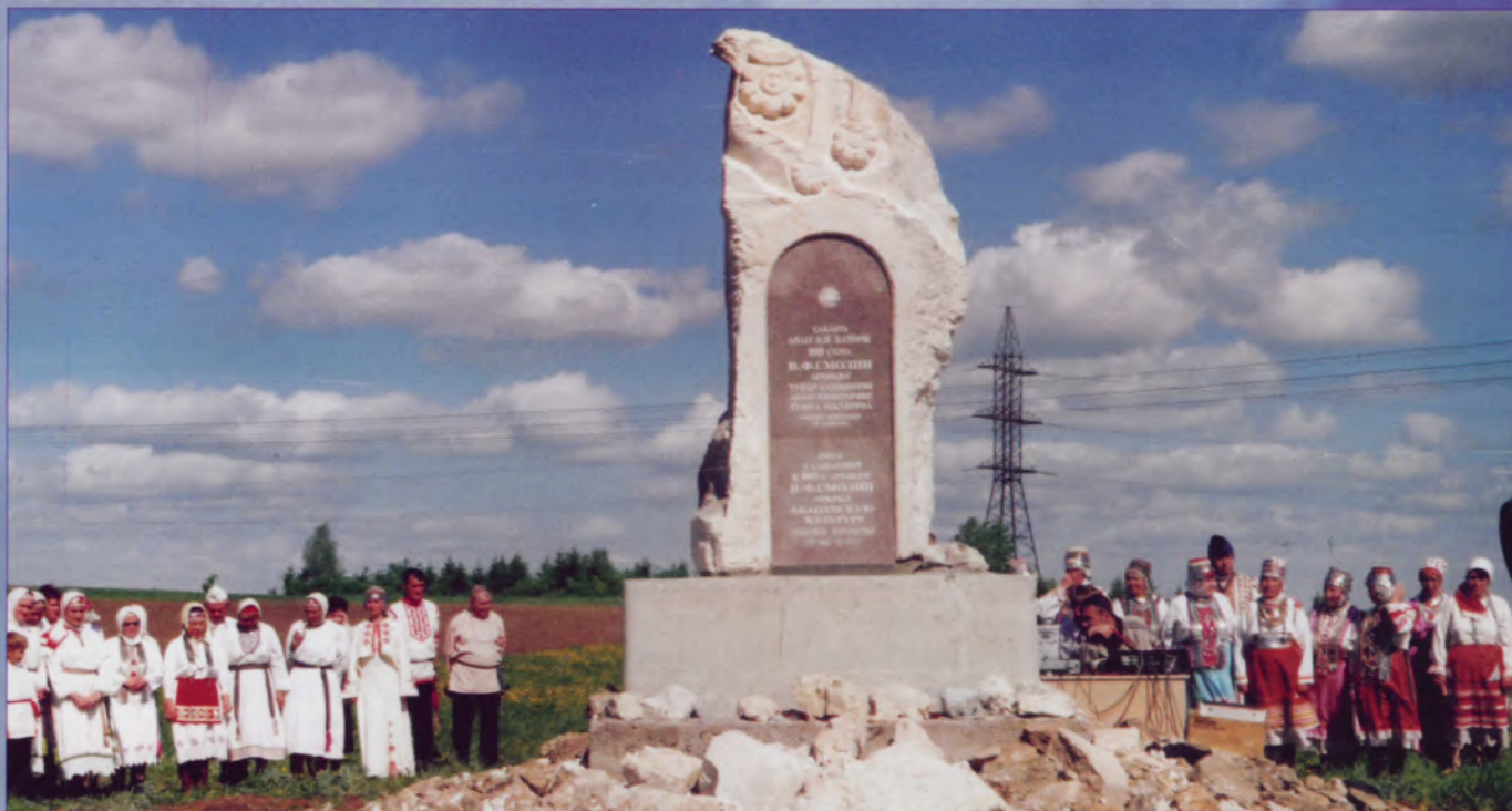
Памятник Абашиевской культуре

рии района, печально известному в народе как «Владимирка», проезжали Александр Радищев, Александр Герцен, Николай Некрасов, Лев Толстой, Павел Мельников-Печерский... Известно также, что в крае был проездом Александр Пушкин. Они оставили добрые воспоминания о чувашах в своих дорожных дневниках. Характерно, что большинство литераторов отмечали типичные черты чувашского народа – его национальную самобытность, врожденную скромность, трудолюбие и честность.