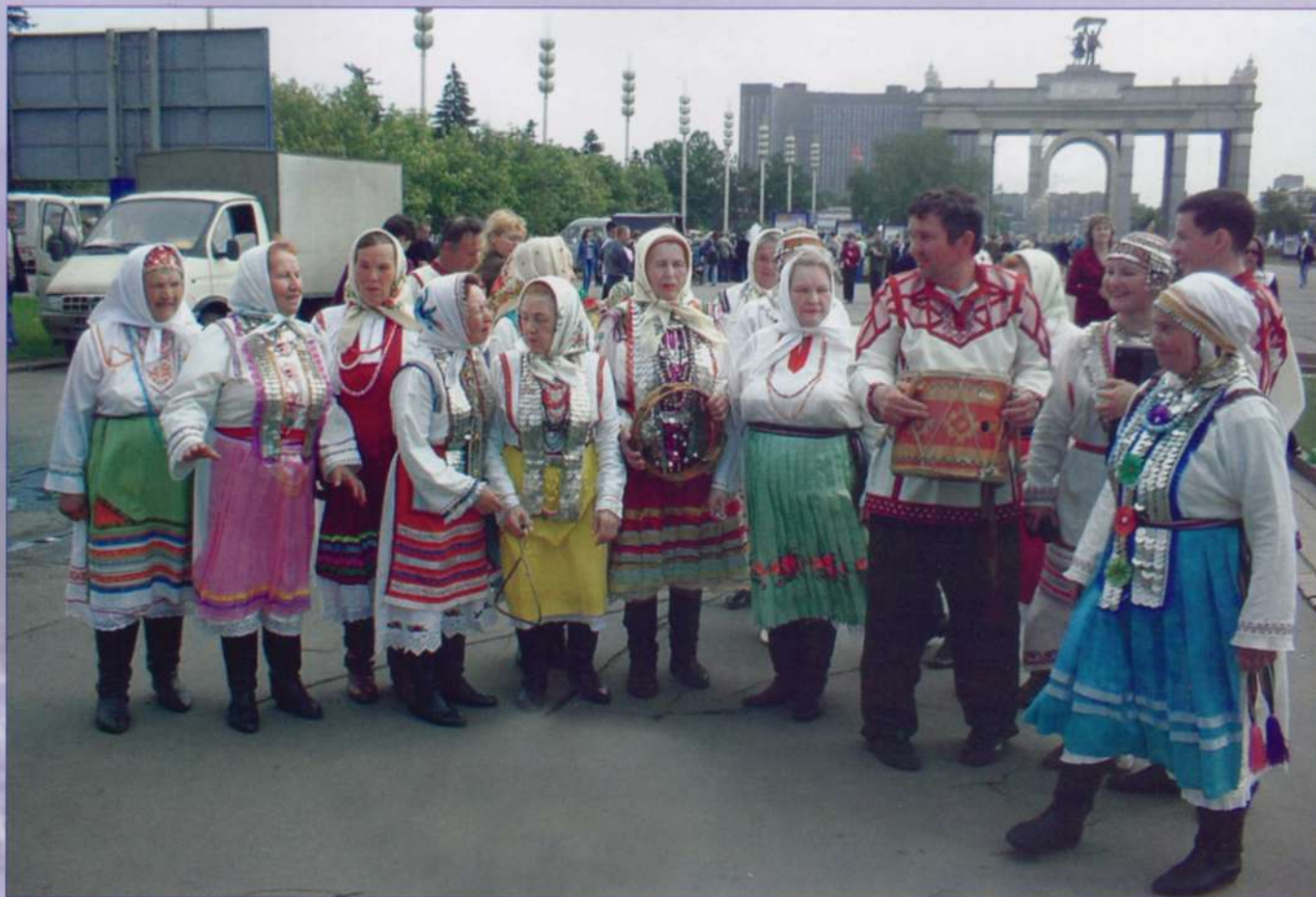
Синьяльский народный ансамбль во Всероссийском выставочном центре

Историю края и современность жители района познают через общение с книгой. В централизованную библиотечную систему входят две районных и 39 сельских библиотек-филиалов. В фонде ЦБС насчитывается 468 тыс. экземпляров, которыми пользуются более половины населения района.