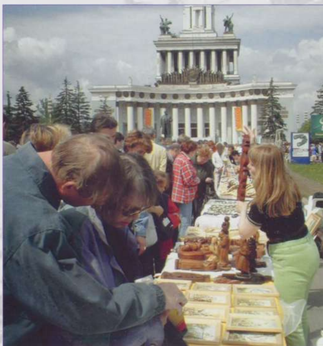
Чувашские поделки в Москве