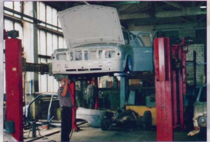
Техника в «Чебоксарагропромтехсервис» будет как новая