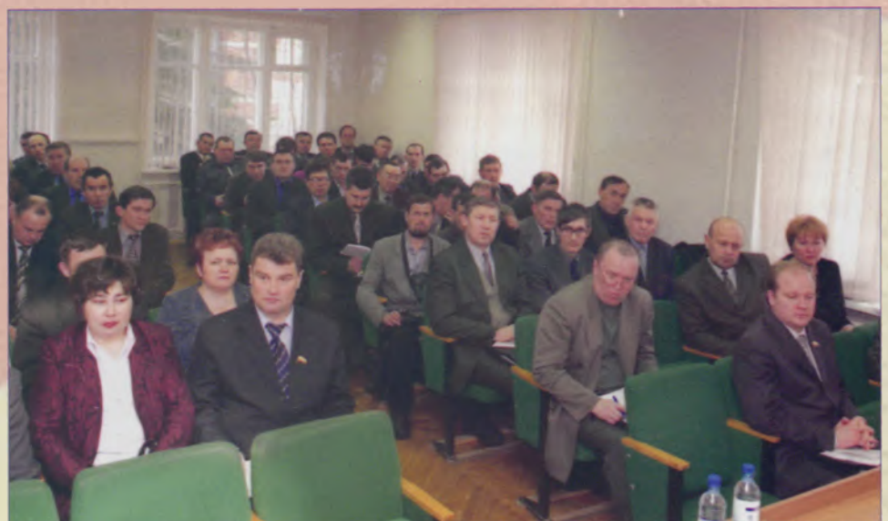
Самые важные решения о настоящем и будущем района принимают депутаты районного Собрания