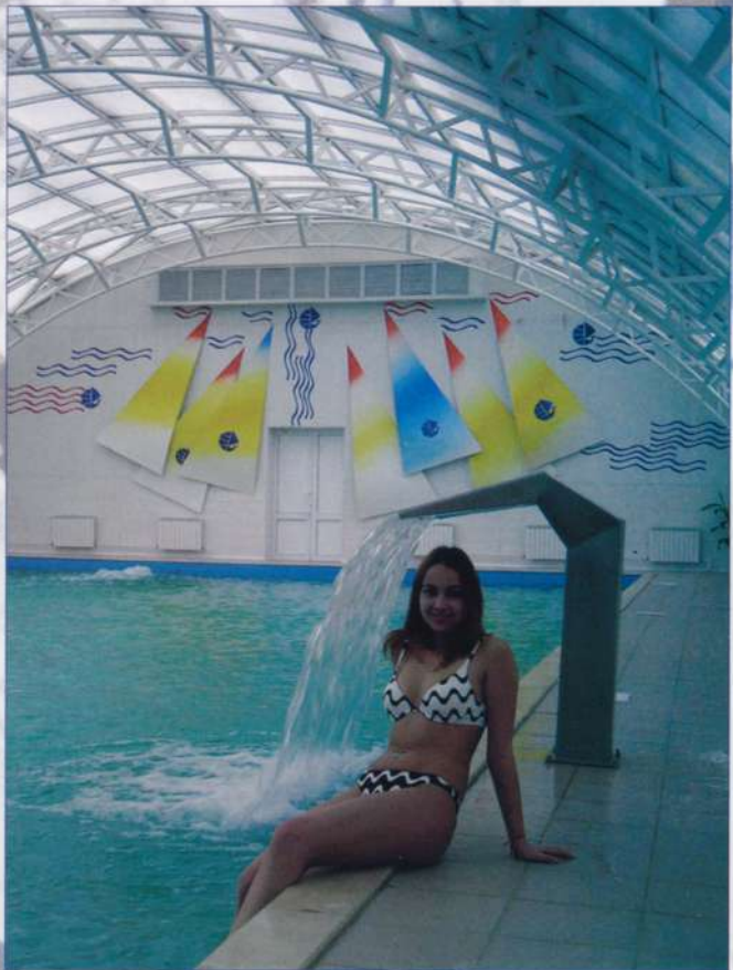
Водные процедуры круглый год