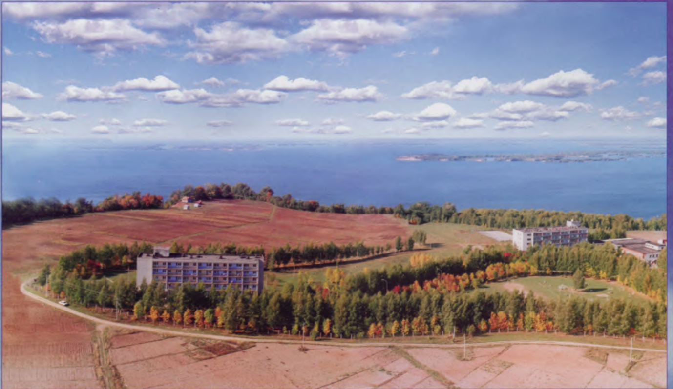
«Волжанка» – на живописном берегу

Ч ебоксарский край с полным правом можно назвать лечебно-оздоровительной жемчужиной Поволжья. Здесь находятся сразу несколько известных санаториев и домов отдыха.