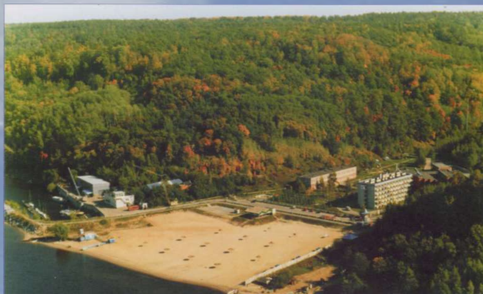
Залит солнцем «Солнечный берег»