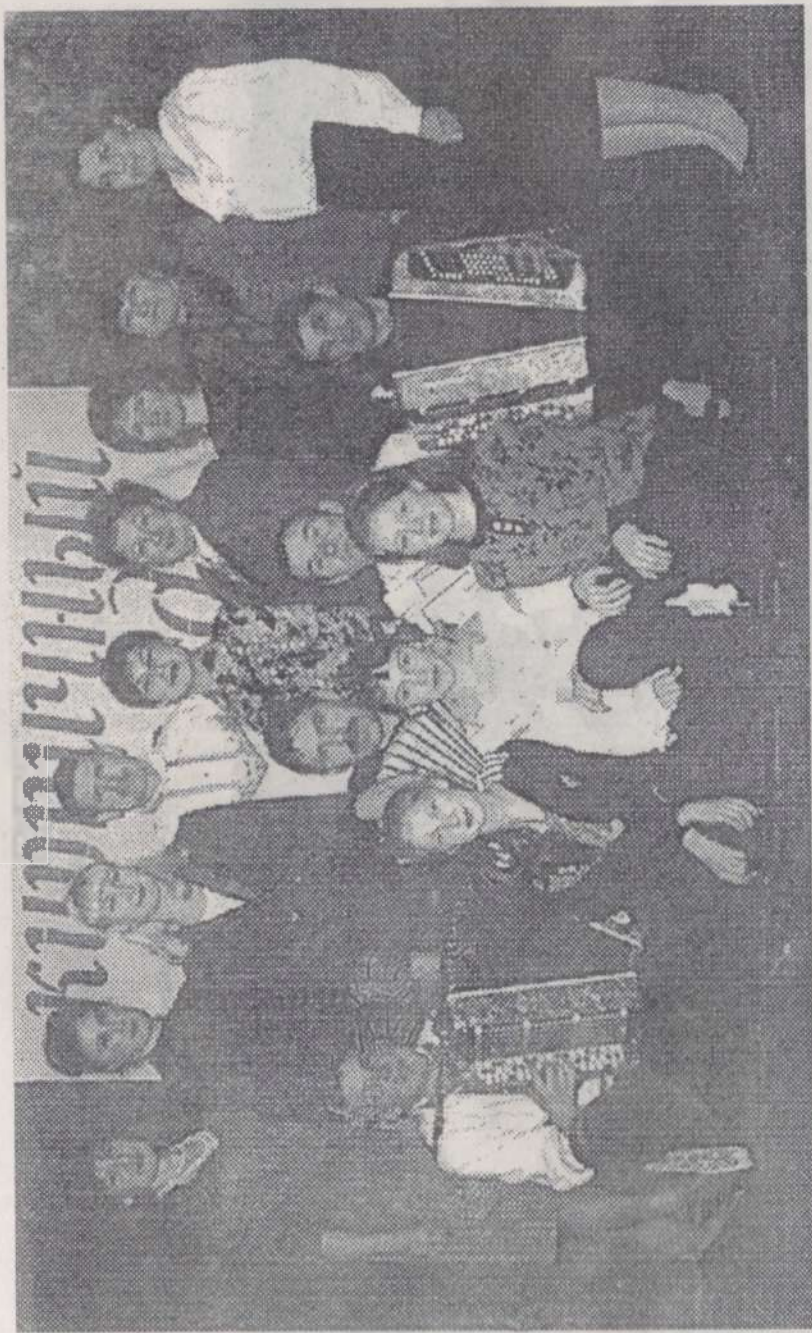
Ишлейри кирпеч заводчән «Пилеш» ансамблән артисчәсем. Олкаш ялѐ. 2000 сул.