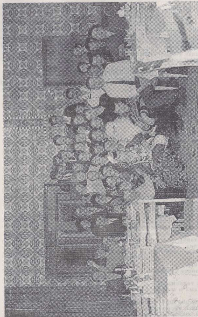
Ишлейри кирпёч заводён коллективё сөнө 2000 сул уявёичө.

Сака пек сыру илтёмёр Шупашкар хулине пуранакан И. Матвеевран. Ана пичете хатёрлесе ситерпө пекехчө — Күкёрри пёр предприятире ёслекен шанкравларө. «Ха сат урла Ишлейри кирпёч заводён директорне тав тума май пурши?» — тесе йитать вал. «Тархасшан, анчах та мён салтава па?» — йиту сине йиту пулчө. Ака мён каласа пачө саксер: — Эрне кун пулчө ку, кантарлахи апат хысшан. Тавансем бирён патамарта тепёр кунне, шамат кун, кирпёч купалама