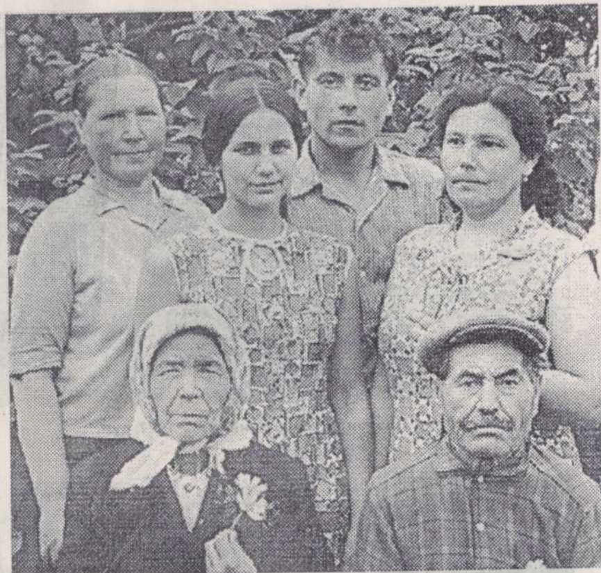
Н. А. Платоновѣн кукашѣпе кукамѣшѣн сѣмьи. 1970 сул.

Если глава сельской администрации избирается гражданами, то в этом случае закононо избранный глава чувствует на работе уверенно, решает все вопросы быстро и оперативно. Не потому ли Моргаушский район, где все главы сельских администраций избирались народом, по некоторым позициям