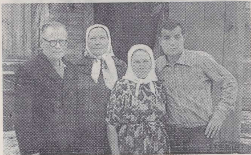
Тэхлчсемпе хатасем. 1978 сул.