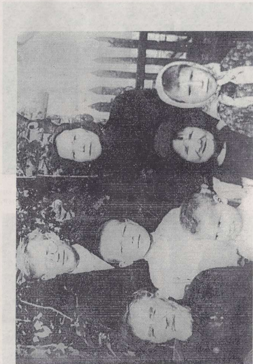
Платоновсен семейи. 1959 жыл.