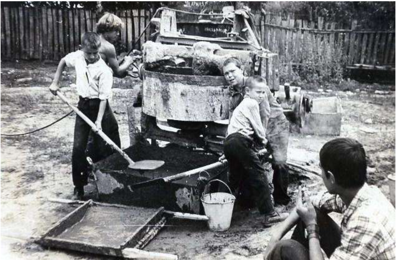
Растворо-бетонный узел, 1983 г