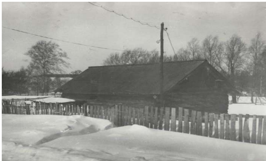
Бывшее правление колхоза «Культура» - зерновой склад колхоза «Звезда»