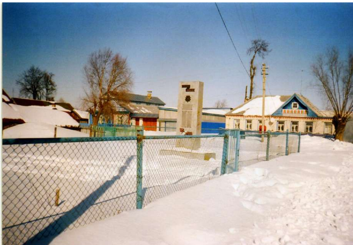
Памятник погибшим односельчанам в Великой Отечественной войне 1941-1945 гг.