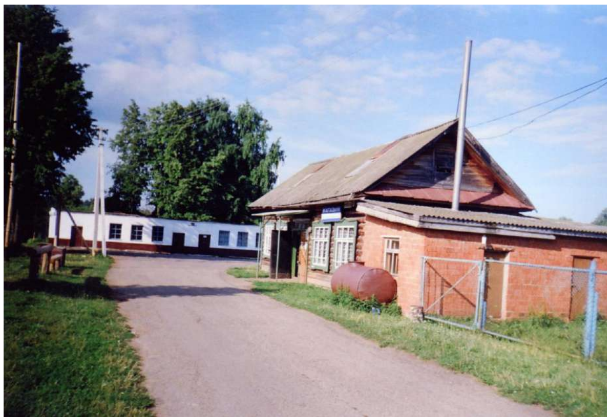
Тохмеевский сельский магазин и Тохмеевский сельский клуб, 2007 г.