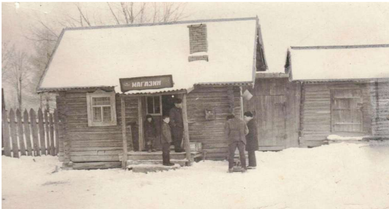
Магазин, 1970 г.