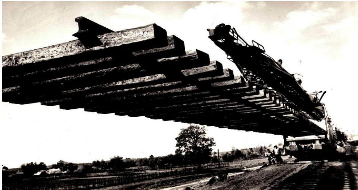
Укладка железнодорожного звена около деревни Тохмеево 1999 г