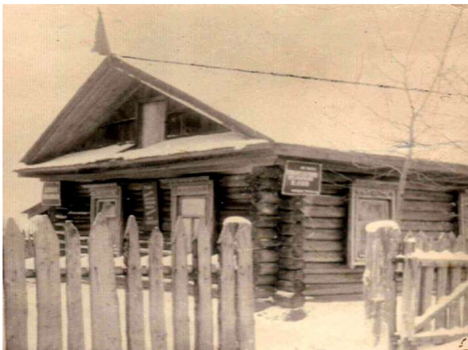
Здание начальной школы (с 1968 г – сельский клуб)