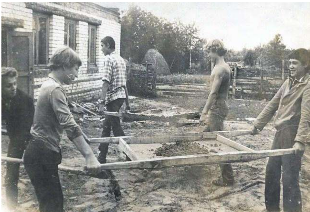
Строительство клуба, 1983 г.

В клубе постоянно проводятся различные мероприятия для людей разного возраста. Вошло в традицию проведение: праздника деревни, новогоднего утренника и бала-маскарада, Рождества Христова, проводов зимы, осеннего бала; КВНов. Специально для детей проводятся вечера игр, различные конкурсы, а для молодежи танцевальные вечера и другие развлекательные мероприятия.