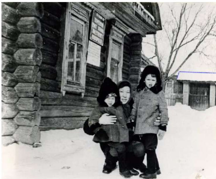
Здание Тохмеевского сельского клуба, 1982 г.

В 1951 году после воссоединения колхозов «Культура» (д. Тохмеево) и «Победа» (д. Шоркино) бывшее пятистенное деревянное здание правления колхоза «Культура» переоборудовали под сельский клуб.